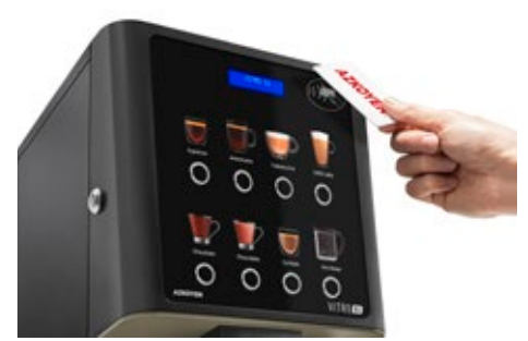
Kit Lector RFID Para tarjeta de recarga producto o sistemas cashless.